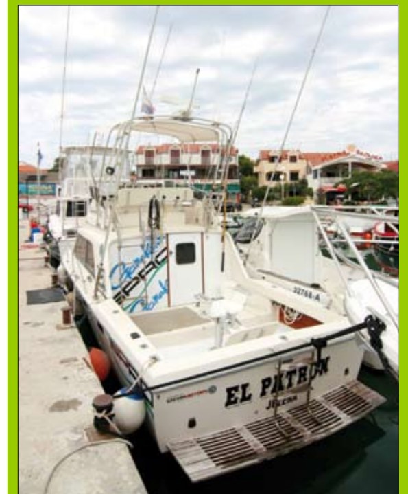
Uitstekend uitgeruste Big Game boten.

Tight Lines Visreizen biedt zowel kortere als langere arrangementen naar Jezera. Kijk voor meer informatie op www.tightlines.nl of bel met (0180) 434788.