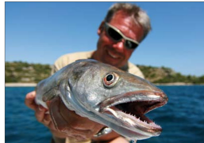
Niet voor niets noemen onze oosterburen zo'n heek 'Seehecht'!