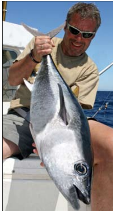
Een kleine blauwvintonijn, maar... de kop is eraf!

daas, waar de tonijn zich naar harte-lust mee aan het volvreten is. Overall om ons heen zien we nu tonijnen jagen en springen, met daartussen nu ook beduidend grotere vissen. Door het enorme voedselaanbod blijkt het echter een uiterst lastige opgave ze vandaag tot bijten te verleiden. Het zint George duidelijk ook niet en om de haverklap komt hij van de brug om weer een ander kleurtje of kunst-aas te wisselen. Pas in de namiddag komt daar uiteindelijk toch weer dat mooie geluid van de Shimano Tiagra die met een bloedsnelheid afloopt. Deze tonijn blijkt zich te hebben vergist in een Rapala Magnum en voelt tamelijk solide aan op de 30 lb hengel. Na diverse forse runs zien we dan toch kleur in het kraakheldere water en spoedig daarop glijdt een fraai gekleurde blauwvintonijn in het net.