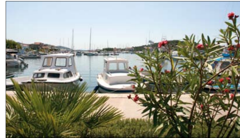
Het mediterrane haventje van Jezera.