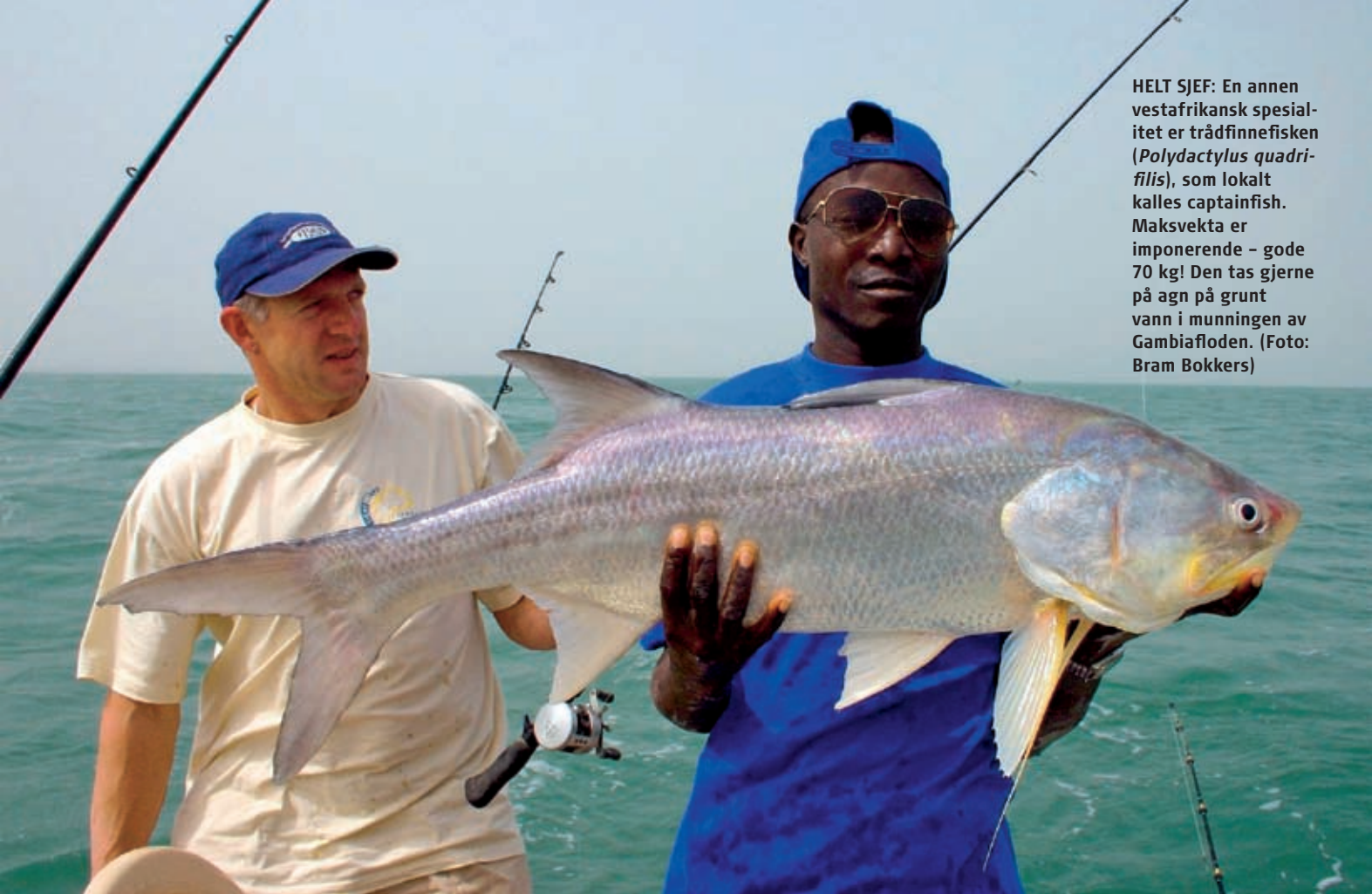
HELT SJEF: En annen vestafrikansk spesialitet er trådfinnefisken ( Polydactylus quadri-filis ), som lokalt kalles captainfish. Maksvekta er imponerende – gode 70 kg! Den tas gjerne på agn på grunt vann i munningen av Gambiafloden.