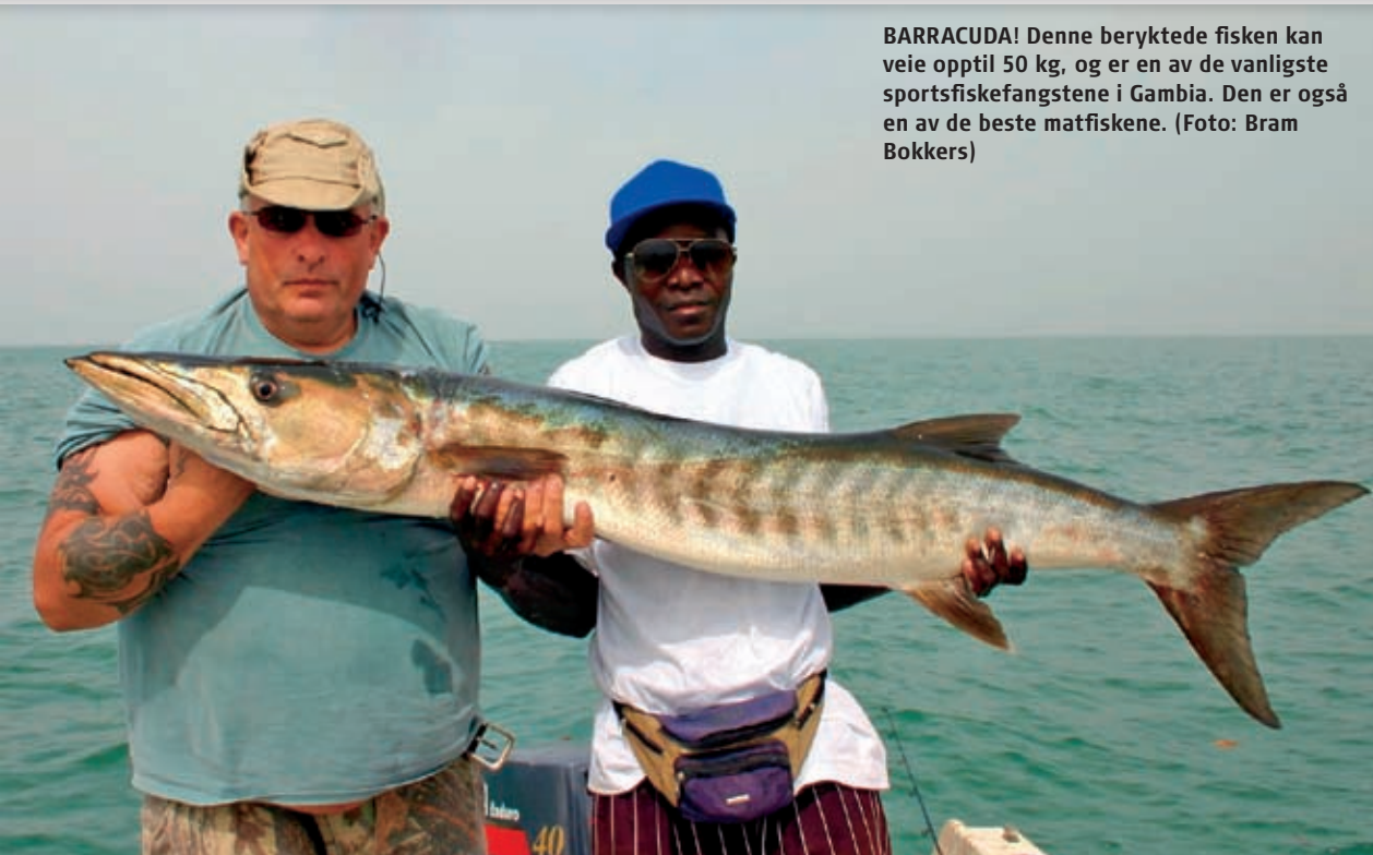
BARRACUDA! Denne beryktede fisken kan veie opptil 50 kg, og er en av de vanligste sportsfiskefangstene i Gambia. Den er også en av de beste matfiskene.