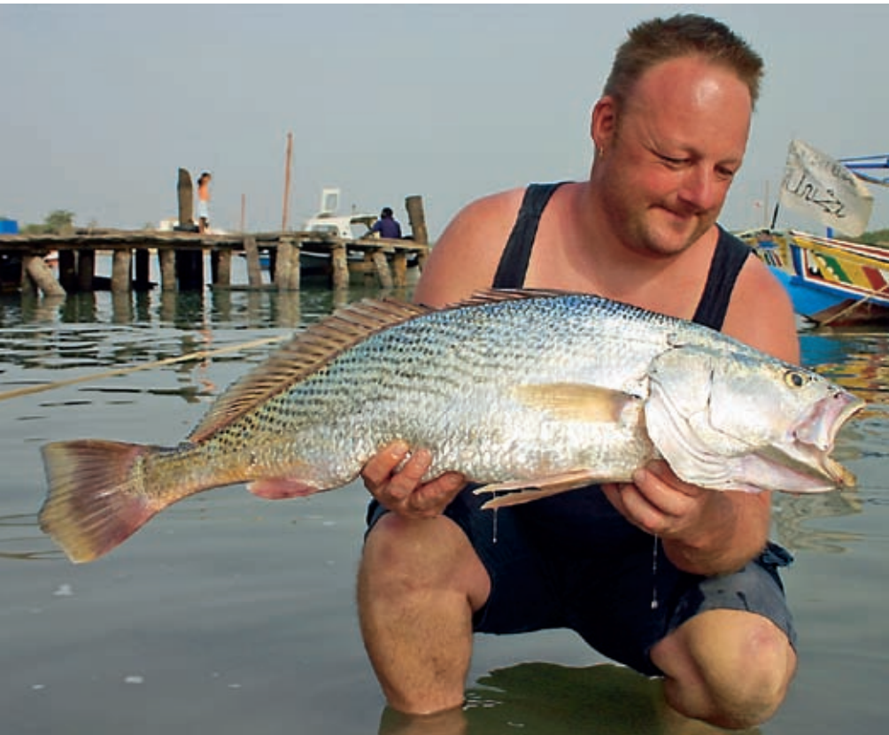
CASSAVA: Cassava ( Pseudotolithus senegalensis ), en av de viktigste fiskeartene i Vest-Afrika, er en vanlig fangst også på stang. En nær slektning, corvina eller ladyfish ( P. typus ) er også vanlig. Begge tilhører ørefiskfamilien.