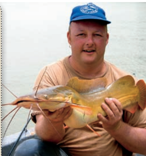
SKJEGGETE FYR: Maller av mange slag finnes langs hele Gambiafloden.

Guiding: Det kan lønne seg å leie en lokal guide. Det er billig, du slipper en del mas og får sett ting som du neppe ville opplevd på egen hånd. Du finner de offisielle guidene utenfor de største hotellene.