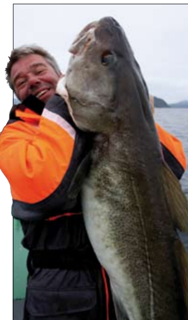
Je moet hier niet op een onsje meer of minder durven kijken...