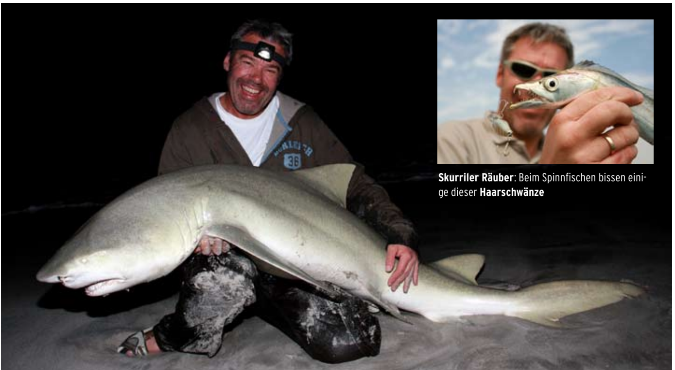
Skurriler Räuber : Beim Spinnfischen bissen einige dieser Haarschwänze