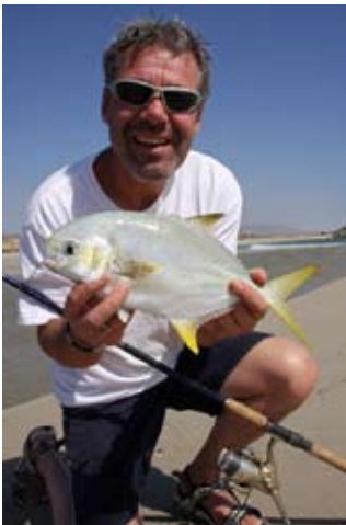
Machen am leichten Spinngerät richtig Laune : kleine Travellies