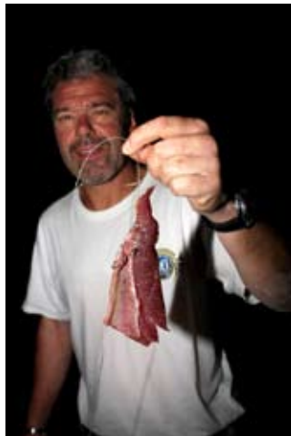
Der Happen für den großen Unbekannten - wir wollten es wissen