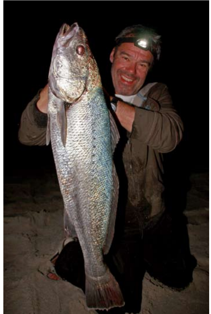
Der erste Dicke im Dunkel der Nacht: ein guter Adlerfisch