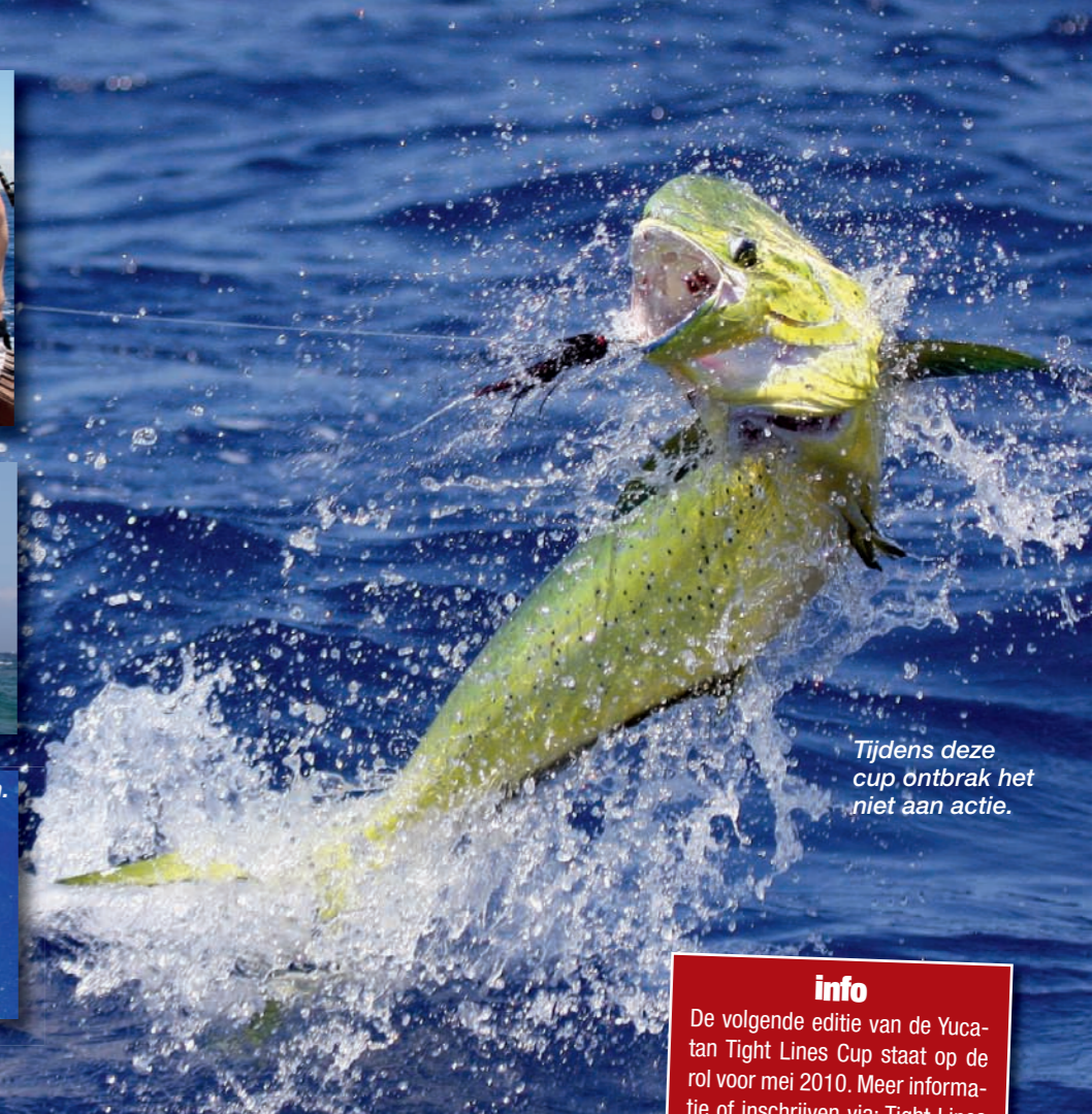
Tijdens deze cup ontbrak het niet aan actie.