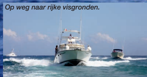
Op weg naar rijke visgronden.