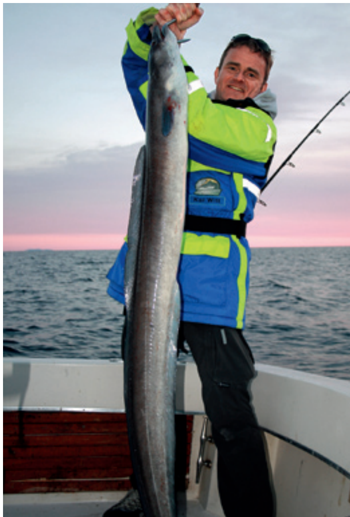
Conger gehören ebenfalls zur Beute, wenn mit Makrelenfilets über Grund geangelt wird

Tun-, Schwertfische und sogar Blauhaie sind im Bereich Big Game an der kroatischen Küste möglich – die beste Periode für den Blauflossen-Tun liegt zwischen Mitte Juli und Anfang Oktober. Doch auch im Verborgenen des Mittelmeeres gibt's etwas entdecken. Wir starteten mit Georg zum Grundangeln vor der Insel Kornat. Er steuerte zielsicher einen Unterwasserberg auf 140 Metern Tiefe an. Ganze Makrelenfilets gingen auf die Reise nach unten. Einfache Paternoster-Montagen mit 6/0er Haken und Rollen mit ausreichend geflochtener Schnur dienten als Mittel zum Zweck. Es dauerte nur wenige Augenblicke, bis der erste harte Biss erfolgte. Die Überraschung war groß, als wir einem zähnestarrenden Seehecht ins Gesicht blickten. Neben Seehechten können auch stramme Conger, Meerbrassen, Grupper (Barsch) und Amber Jacks beim Grundangeln in Kroatien beißen. Nach diesen großartigen Erlebnissen an der kroatischen Adria hoffe ich sehnlichst auf einen Anruf von Georg im Sommer 2009.