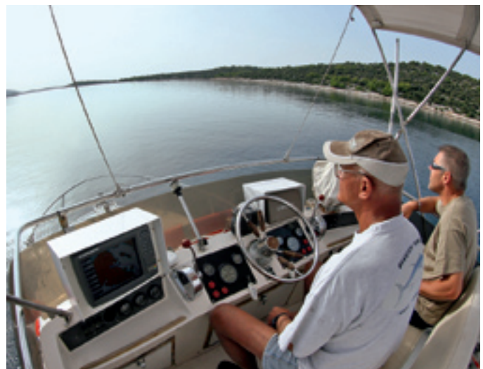
Perfekt ausgestattet: die „ El Patron “