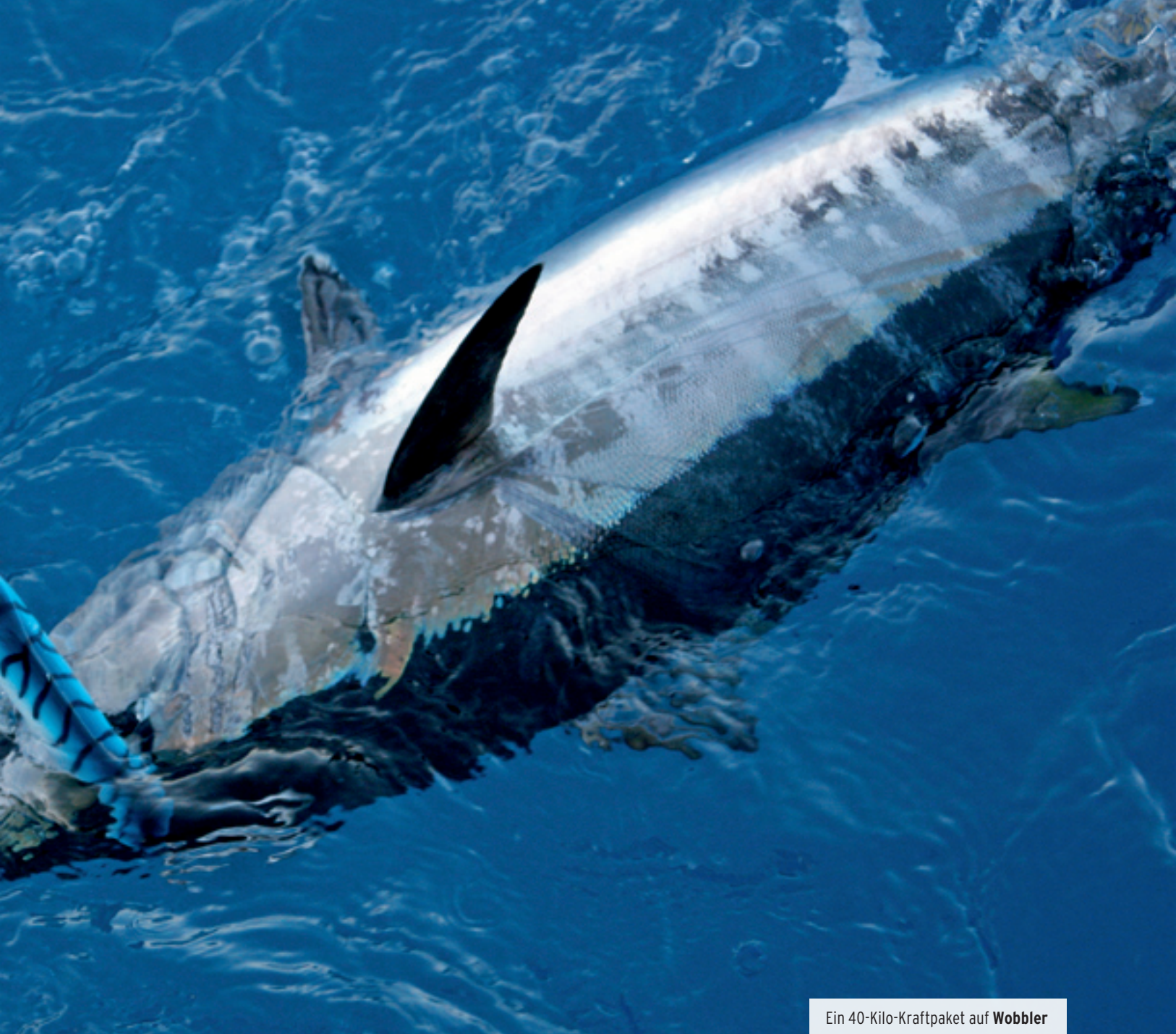
Ein 40-Kilo-Kraftpaket auf Wobbler