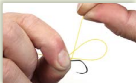
3 Pak het uiteinde van je lijn vast en sla deze om zowel de haaksteel als de lus.