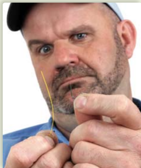
"De haak en de lijn zijn nog los van elkaar, eens kijken hoe ik dat verander..."

We beginnen deze serie met de bledknoop omdat ik vind dat een rechtgeaarde sportvisser zelf een haakje aan de lijn moet kunnen zetten. Deze knoop kun je gebruiken voor zowel piepkleine witvishaakjes maat 24 als zware 1/0 zeevishaken. Het is de makkelijkste knoop om snel een haakje aan de hoofd- of onderlijn te zetten.