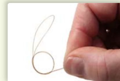
3 Leg nu een eenvoudige 'oude-wijvenknoop' in het dubbelgeslagen uiteinde. Voor de zekerheid haal je de lijn tweemaal door.