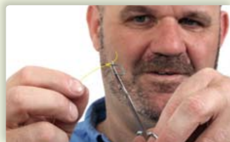
7 Knip het uiteinde kort af. Zo kun je ook fragiele aas als een mestpiertje er nog overheen schuiven zonder dat deze beschadigt.