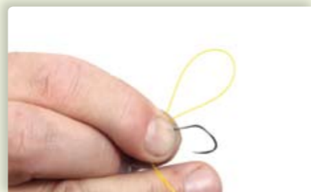
2 Plaats de haaksteel naast de lus tussen je duim en middelvinger.