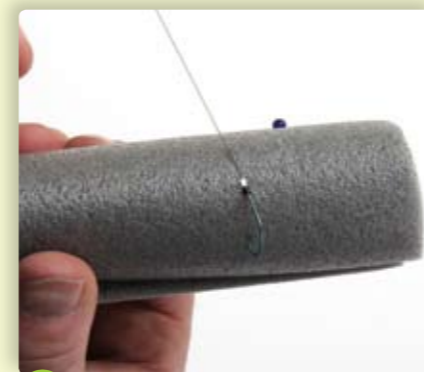
1 Prik de haakpunt in de isolatierol.

Natuurlijk wil je zelfgemaakte onderlijnen ook netjes opbergen. Er zijn verschillende opbergsystemen te koop, maar een stuk isolatierol met wat spelden werkt ook perfect – misschien wel beter. Het voordeel hiervan is dat je de onderlijn zeker niet beschadigt en dat je elke lengte onderlijn zonder problemen kunt opbergen. Hier zie je hoe je dit doet.