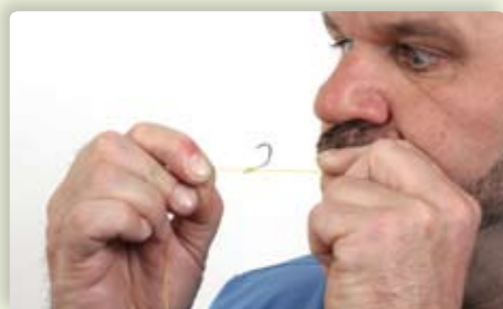
6 Bevochtig de knoop lichtjes met wat speeksel en trek het geheel voorzichtig maar stevig aan. Let erop dat de lijn altijd aan de binnenkant van de haaksteel zit.