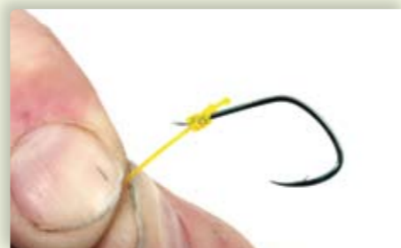
8 Het resultaat is een perfecte knoop waarmee je elk haakje met een bledje muurvast op de hoofd- of onderlijn zet.