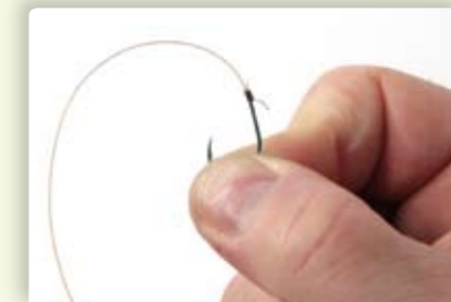
1 Bevestig de haak aan een nylon lijn naar keuze, uiteraard middels de bledknoop.

Je kunt zo'n onderlijn heel makkelijk zelf maken. Het voordeel van zelf maken is dat je eindeloos kunt variëren met lijndiktes en haakmaten. Bovendien is het veel goedkoper dan onderlijnen kopen. Hier zie je hoe je in een paar stappen zelf je onderlijn maakt.