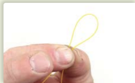
1 Leg het uiteinde van de lijn dubbel zodat er een lusje ontstaat.