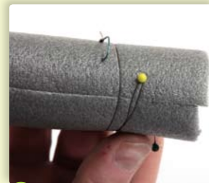
2 Wikkel de onderlijn rond de rol totdat je bij de lus uitkomt en prik de onderlijn met de speld vast in de isolatierol. Per strekkende centimeter rol kun je ongeveer één onderlijn kwijt.