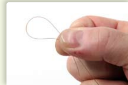
2 Knip de lijn op de gewenste lengte af en leg het uiteinde dubbel tussen duim en wijsvinger.