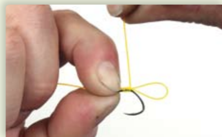
4 Herhaal stap 3 nog vijf keer zodat je in totaal zes wikkelingen hebt gemaakt.